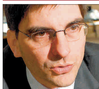
«Die Risiken sind gegenüber der letzten Prognose gestiegen.»

Angesichts zunehmender Liquiditäts- oder sogar vereinzelter Solvenzprobleme bei einigen Finanzinstituten könnte die Krise noch einige Monate andauern.